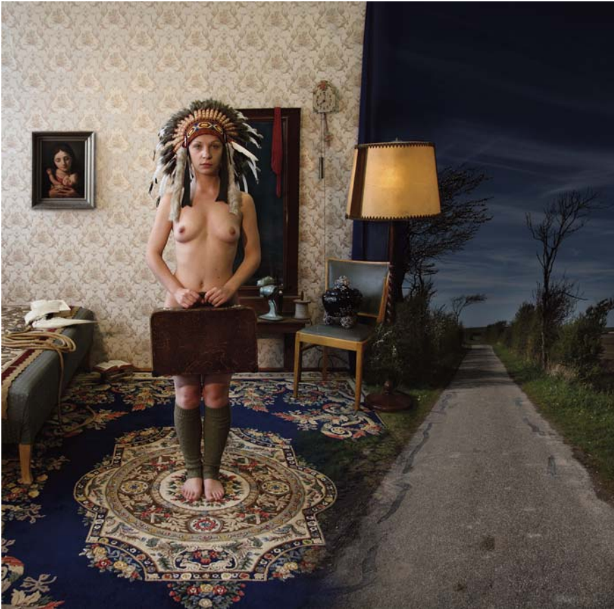
Achterkleindochter / Wenn Du mal groß bist, möchte ich so sein wie ich! 2010 Inkjetprint 60cm x 60cm 7er Auflage

Es gibt niemals nur einen Grund, einen Weg, eine Ursache oder eine Wirkung. Jede Geschichte einer Familie oder eines Menschen besteht aus anderen Menschen an wechselnden Orten. Diese Geschichten sind nicht unmittelbar lesbar, nicht einfach sprachlich oder bildlich faßbar – zu viele Einzelheiten gehen verloren, Unwichtiges wird mit der Zeit betont und erlangt einen Stellenwert, der nichts in der vergangenen Zeit zu tun hat aber eben doch ein vermeintliches Verstehen prägt oder zumindest suggeriert. Grenzen werden überschritten und die Familien der Personen meiner Geschichte kamen zu Beginn des letzten Jahrhunderts aus Holland oder anderen Ländern an die Ruhr und haben so gezeigte Orte verbunden. Wir können versuchen, Leute aufgrund ihrer Vorlieben, ihrem Lächeln, ihrer Bildung, Tränen, Haustiere, Haltung und Mimik, ihrer Herkunft, ihren Vor- oder Nachfahren, ihrer Mode, Autos, ihres Sports, der Augenfarbe, Zahnstellung oder ihrer Frisur einzuordnen, zu fürchten und lieben oder auch zu beurteilen